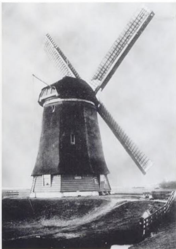
Afb. 69. De tweede watermolen daterend uit 1612.